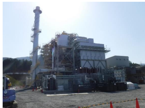
④ ボイラー・排水処理設備